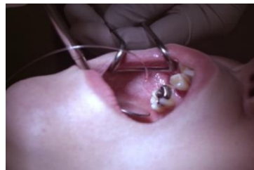
口腔乾燥症のカテーテル治療

また、頭頸部血管をはじめとする各種の臓器についてもMRIを用いた独自の特殊な画像技術に基づき映像化し、超音波など他の検査技術と組み合わせた診断や機能の評価を実施し、治療や予防を積極的に進めています。